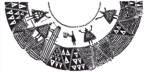
Sopron (H) (Hoernes 1915)