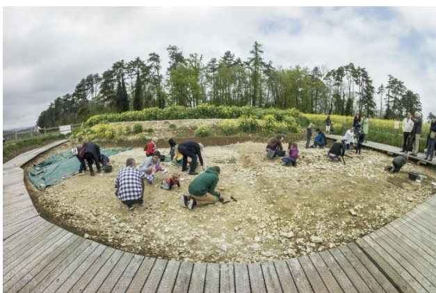
Excavation at Banné

De même, le Site du Mois a été présenté au Milestone du Tourisme 2015 et aux Heritage in Motion Awards 2016.