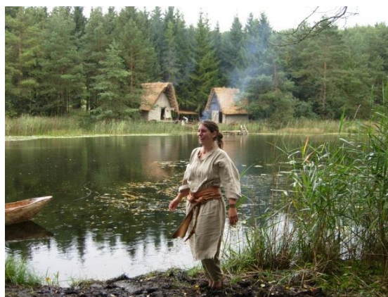
Die Pfahlbauer von Pfyn>>, Swiss Television, Swiss Aktuell